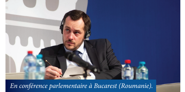
En conférence parlementaire à Bucarest (Roumanie).