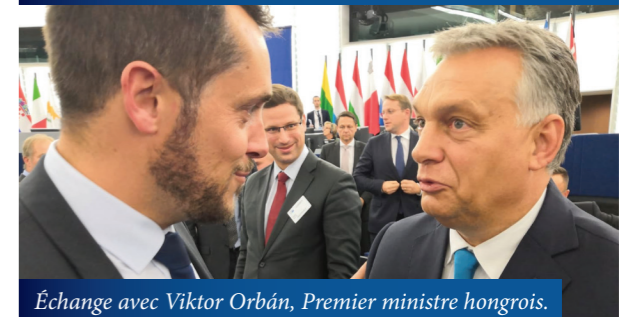
Échange avec Viktor Orbán, Premier ministre hongrois.