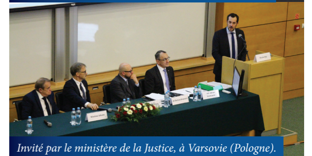
Invité par le ministère de la Justice, à Varsovie (Pologne).