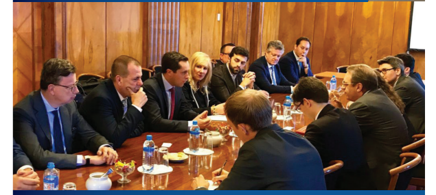
Réunion à Moscou avec le Vice-ministre des Affaires étrangères.