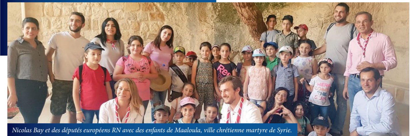
Nicolas Bay et des députés européens RN avec des enfants de Maaloula, ville chrétienne martyre de Syrie.