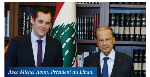
Avec Michel Aoun, Président du Liban.